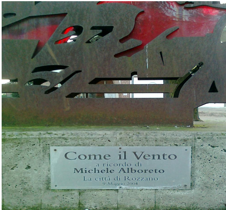
Il monumento in onore di Michele Alboreto a ROZZANO (Mi)